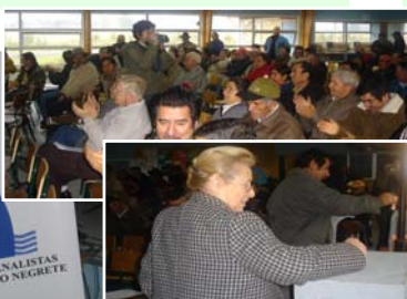
Elecciones de nuevo Directorio y Comisión Revisora de Cuentas